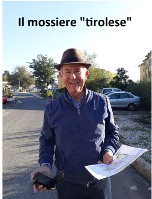
Il mossiere "tirolese"

Questa deviazione mi permette di conoscere Toffia, un paesino su uno sperone roccioso, una delizia paesaggistica. Sbucato sulla Salaria vecchia il mio istinto "mancino" non mi fa sbagliare fino ad imbucare l'erta finale, molto dura, anche se non molto lunga. Un vigile urbano incrociato in macchina mi suggerisce di allestire il traguardo sulla piazzetta del paese, e "siamo molto contenti che abbiate scelto Poggio San Lorenzo per la vostra tappa ciclistica". ☑ così è: i paesani dopo qualche istante assistono divertiti ed attenti alla conclusione della Kermesse Turbike: una nonnina, su mio invito, accetta un panino con prosciutto e ringrazia ... la piazzetta si rivela un bel palcoscenico per la conclusione del duro impegno agonistico dei Turbikers. Il tavolo con il prosciutto è preso d' assalto ..." beati gli ultimi se i primi saranno ... corretti", ed infatti ... alla fine ... purtroppo ... ci sarà qualcuno che non potrà ringraziare chi è arrivato prima di lui ... è stato sbafato e bevuto TUTTO!!!