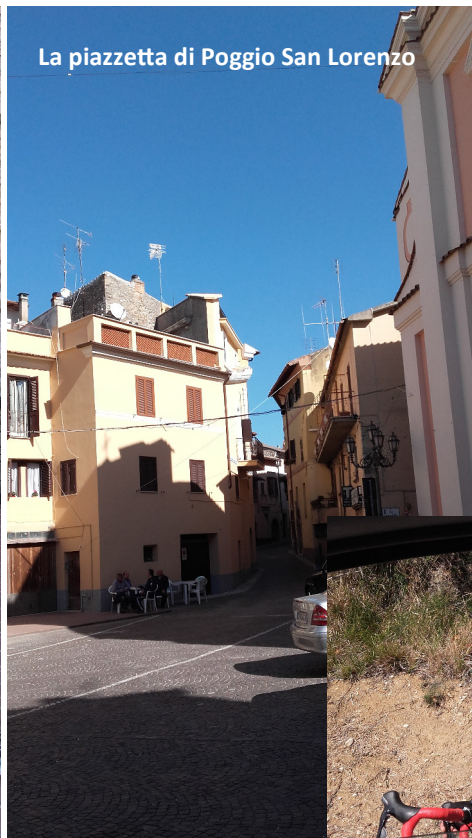
La piazzetta di Poggio San Lorenzo