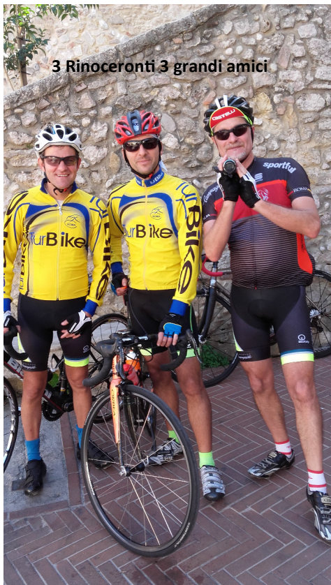
3 Rinoceronti 3 grandi amici

Claudio Scatteia La Maglia Nera del Turbike